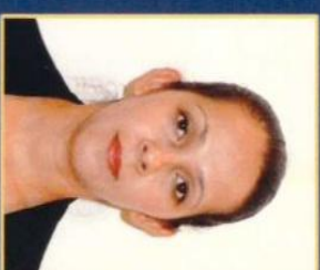
Área de Seguridad Mejor colaboradora del mes

Enhorabuena por el compromiso y dedicación demostrada para con la empresa y tus compañeros. Te animamos a seguir demostrando tu gran potencial.